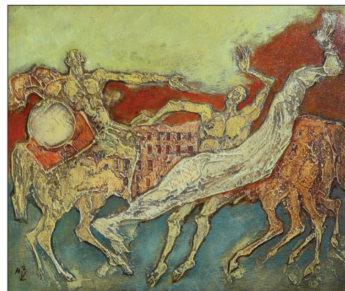
Lucrare de Marcel Voinea