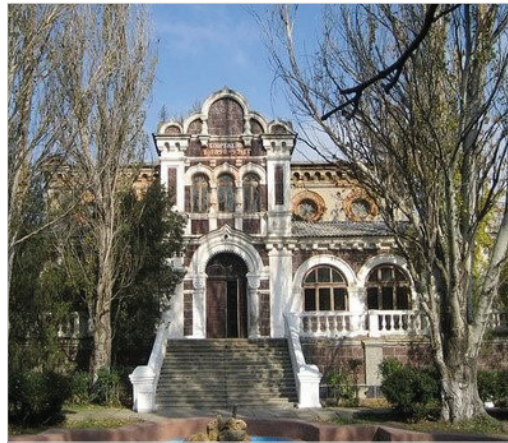
Palatul Sanatoriului de la Kuialnik, azi abandonat

Instituția balneară a dr. Iahimovici, se afla nu departe de Odesa, pe malul Kuialnikului, și funcționa din anul 1882. Un sanatoriu mai modest față de cel orașenesc, dar beneficia de aer marin curat, de liniște și de posibilitatea aprovizionării cu legume și fructe proaspete. Ne mai vorbind că parcul din jurul pavilionului, abundând în verdeață, era un loc minunat pentru plimbare și reculegere. La început a fost construit un singur pavilion apoi sanatoriul s-a dezvoltat. De căpătâi erau însă apele curative și nămolul salin. În băile interioare apa și nămolul pentru tratament erau încălzite.